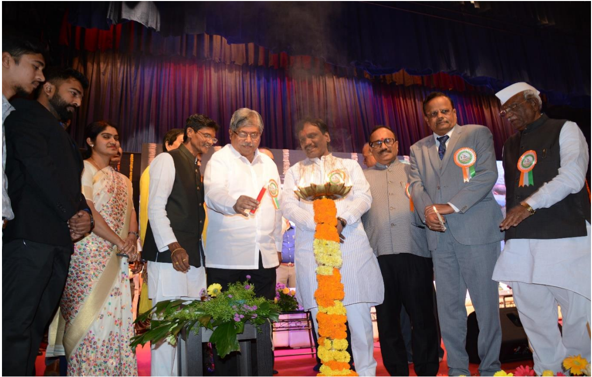
Innauguration with lightening of lamp by Hon.Chadrakant Dada Patil, Minister,Higher and Technical Education,Maharashtra