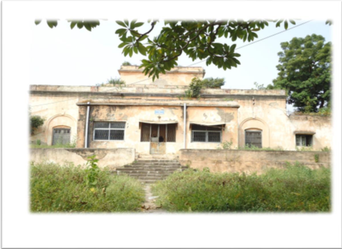
Aadil Darwaza ,the main entrance of the college after renovation under smart city project