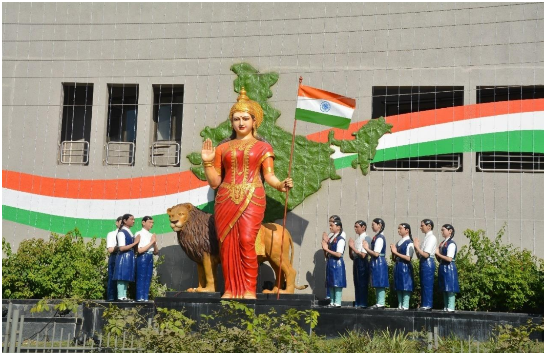
Statue of Bharat Mata at the entrance of auditorium