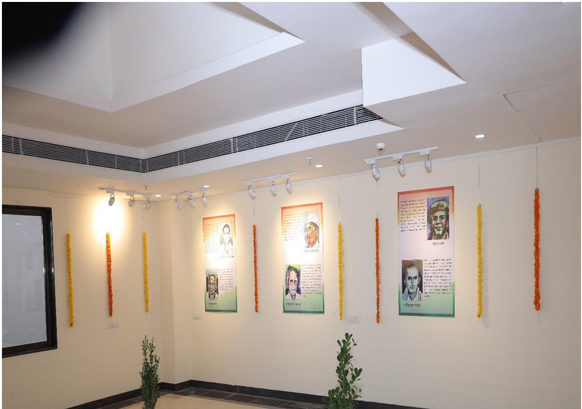
Government College Boys Hostel, THE PLACE FROM WHERE THE CLARION CALL OF VANDE MATARAM WAS GIVEN