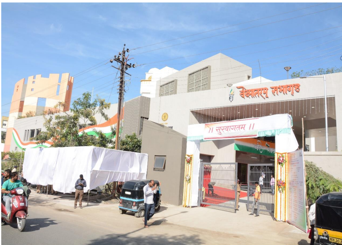
Vande Mataram Auditorium