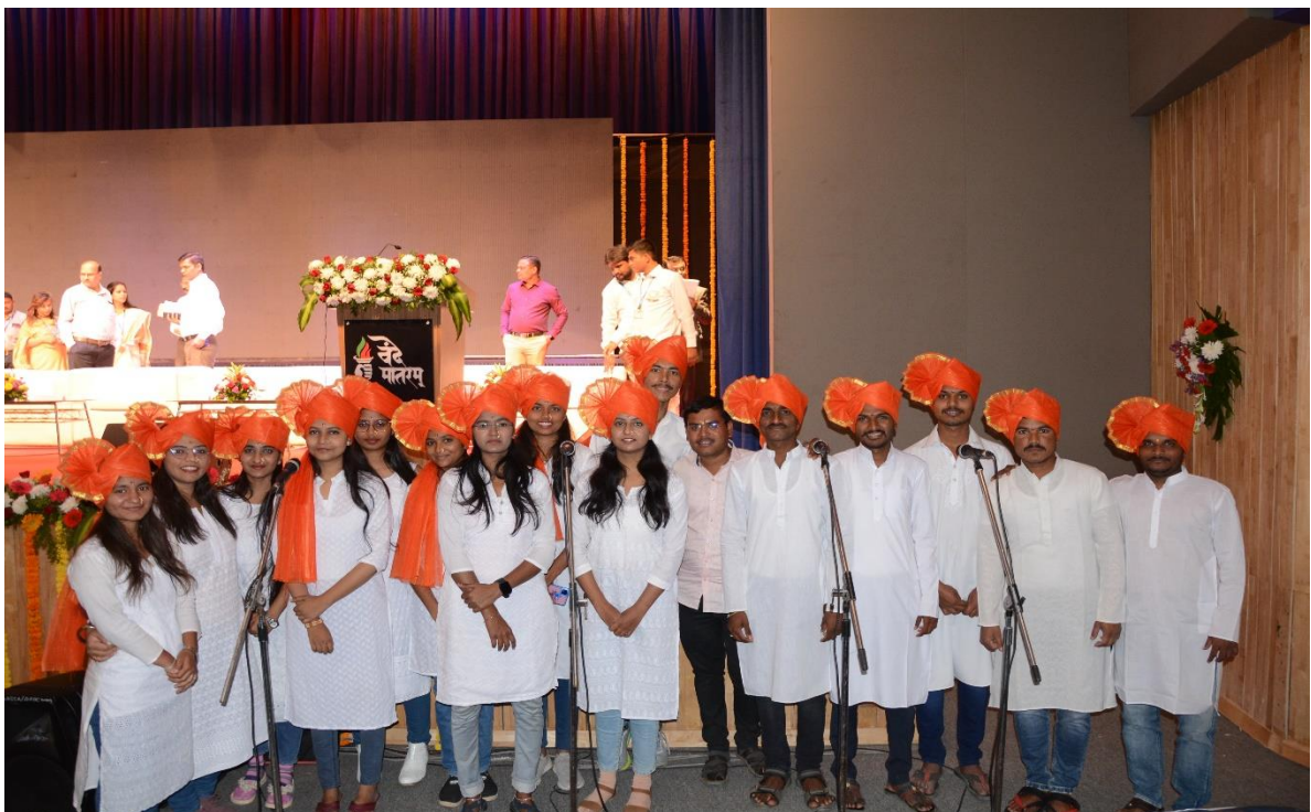
Welcome Song by the Students of Music Department, Government College Of Arts & Science, Aurangabad