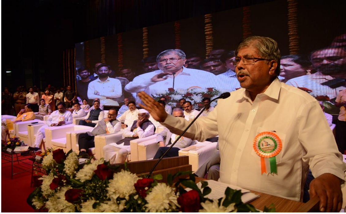
Inguaral Address by Hon.Chandrakant dada Patil,Minister,Higher and Technical Education,Maharashtra