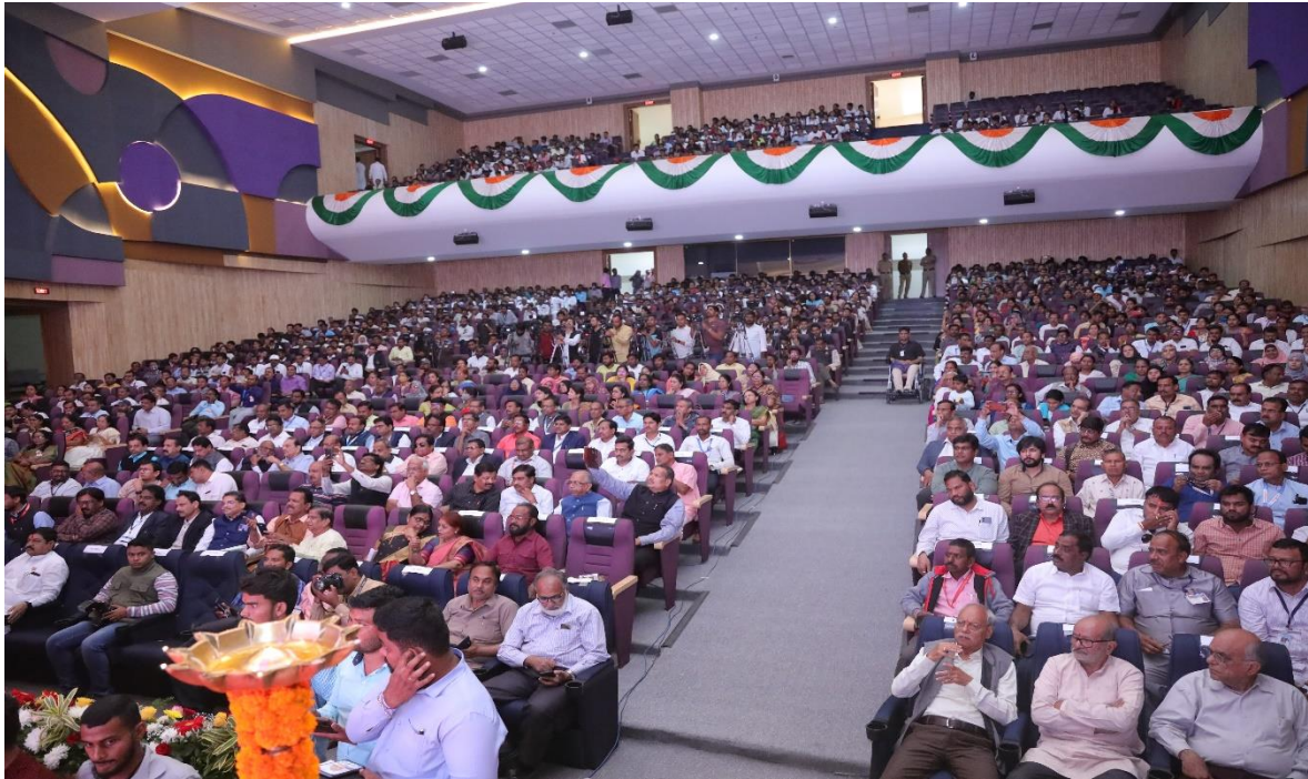
Audience in inguaral function